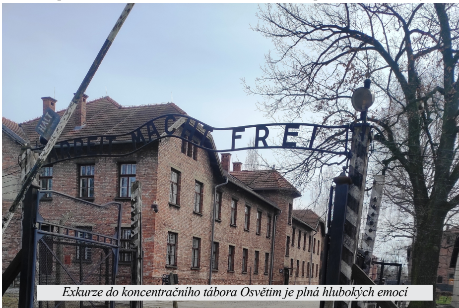
Exkurze do koncentračního tábora Osvětim je plná hlubokých emocí

Celkově lze tedy tento zájezd považovat za jedinečný a nezapomenutelný. Zatímco návštěva Osvětimi přinesla hluboké historické ponaučení, solný důl