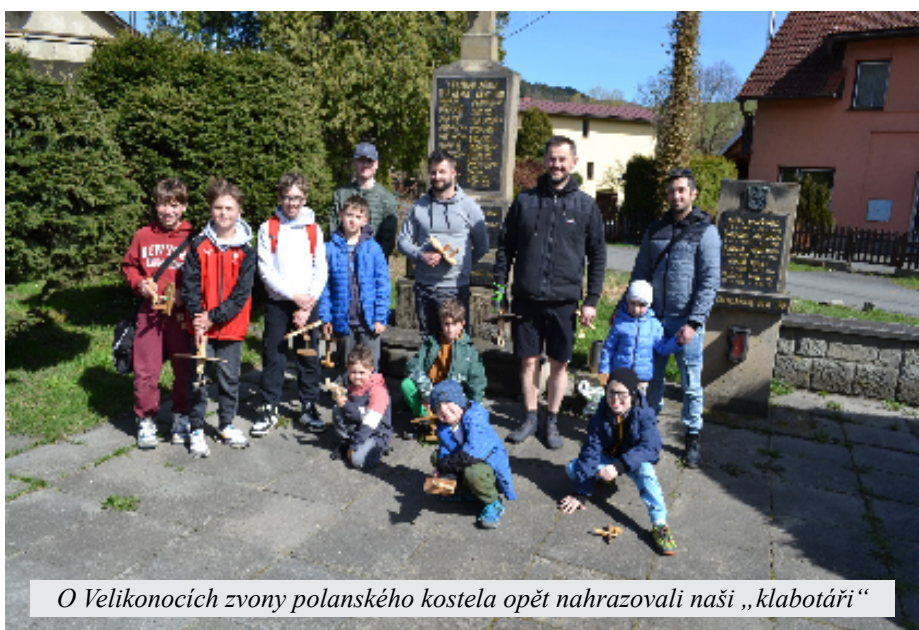
O Velikonocích zvony polanského kostela opět nahrazovali naši „klabotáři“

Schválený rozpočet na rok 2024 počítá s příjmy ve výši 36.606 tis Kč a s výdaji 48.218 tis. Kč, což znamená