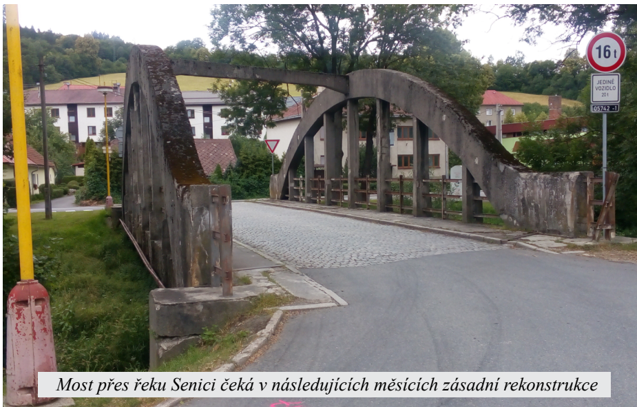
Most přes řeku Senici čeká v následujících měsících zásadní rekonstrukce

Dále se bude pracovat na studii rozšíření hřbitova na v loni zakoupeném pozemku pod stávajícím hřbitovem.